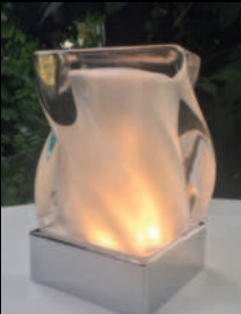
Quarz Wave PLS-TL-07