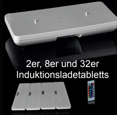
2er, 8er und 32er Induktionsladetablets