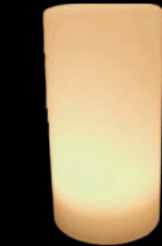
Satin Tower PLS-TL-04