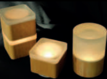
Woody Serie PLS-TL-18

Hochwertige Oberflächen, ansprechende und werthaltige Haptik, spannende Formen und natürlich hochwertiges Licht erstellen auf Ihren Tischen ein nachhaltiges Wohlfühlklima und eine ansprechende Optik. Ihre liebevoll zubereiteten und präsentierten Gerichte bekommen so auch bei wenig Umgebungslicht zur dementsprechenden Geltung. Nach den Gängen kann die Tischbeleuchtung von „funktional“ auf gemütlich bis hin zu romantisch runtergedimmt, oder jede beliebige Farbe gewählt werden.