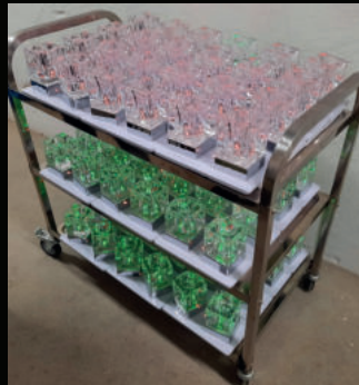
Edelstahl Ladewagen bis zu 96 Stk.

Rufen Sie uns einfach an und vereinbaren einen unverbindlichen Beratungstermin !