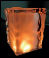
Quarz Vision PLS-TL-08