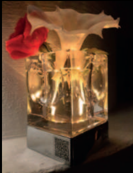
Kristall Star Vase PLS-TL-09