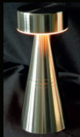
Premium Design Highend Line