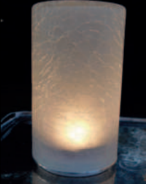
Vintage Tower PLS-TL-06