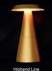
Highend Line Excelsior PLS-TL-21