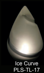
Ice Curve PLS-TL-17